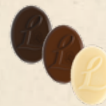
LOUISE Praliné saveur caramel, Praliné saveur caramel aux noisettes caramélisées