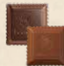
CARRÉ CROQUANT Praliné au riz soufflé