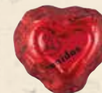
FOREVER ROUGE Chocolat au lait, praliné