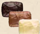
NOISETTE MASQUÉE Praliné avec une noisette entière