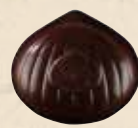
MARRON NOISETTE NOIR Praliné saveur café aux noisettes caramélisées