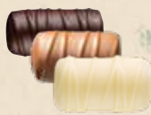
BÛCHE PRALINÉ Praliné tendre