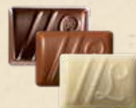
DUETTO Ganache au chocolat noir à la fraise et vinaigre balsamique ou au chocolat au lait, crème de nougat et graines de sésame ou au chocolat noir yuzu et saveur fruit du dragon

Ces chocolats ne représentent qu'une partie de notre offre.