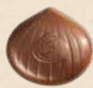
MARRON CAFÉ LAIT Praliné saveur café